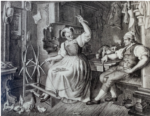
Abbildung 2: Spinnerin bei der Arbeit in der Stube. Radierung von Johann Ulrich Schellenberg, 1789. TML.

Das Spinnen von Baumwollgarn wurde also zwischen 1730 und 1740 heimisch im Toggenburg. Diese Arbeit wurde von der weiblichen Bevölkerung und von Kindern oder älteren Männern ausgeübt. Gegen Ende des Jahrhunderts wurde die Baumwollweberei immer wichtiger, weil die Heimspinner gegenüber der britischen Maschinenproduktion nicht mehr konkurrenzfähig waren.