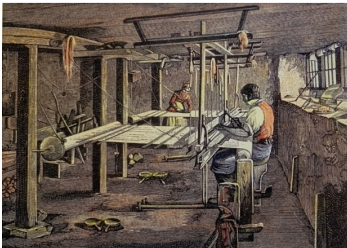
Abbildung 3: Weber bei der Arbeit im Keller. Holzstich nach einem Aquarell von Johannes Schiess. TML.

Spinner und Weber arbeiteten im Auftrag eines Unternehmers, übten ihr Gewerbe also in Heimarbeit aus. Anfangs waren die Fabrikanten meist sesshaft in grösseren Zentren wie St. Gallen oder Winterthur. Doch werden ab Mitte des 18. Jahrhunderts zunehmend Toggenburger Fabrikanten oder Unternehmer fassbar. Zwischen den Heimarbeitern und den Arbeitgebern übernahm ein sog. Fergger die Rolle des Vermittlers. Er brachte den Arbeitern die Rohstoffe und nahm die fertigen Produkte gegen Bezahlung ab. Die Heimarbeiter bzw. die Heimarbeiterinnen stammten meist aus Kleinbauernfamilien. Diese sahen im Spinnen oder Weben einen willkommenen Nebenverdienst. Schon bald gab es im Toggenburg kaum mehr einen Haushalt, in dem nicht ein Familienmitglied mit Spinnen oder Weben beschäftigt war.